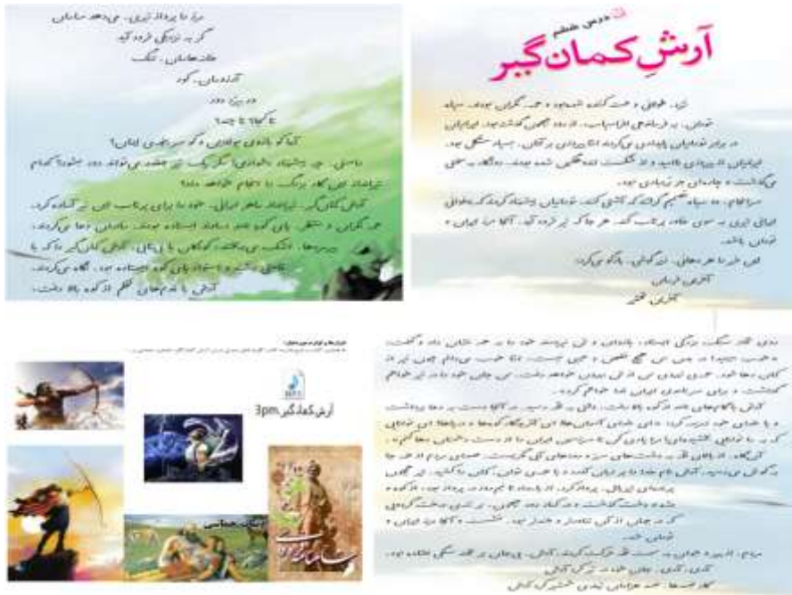
نمونه طرح درس مربوط به طرح خوانا (درس ۶ فارسی چهارم)