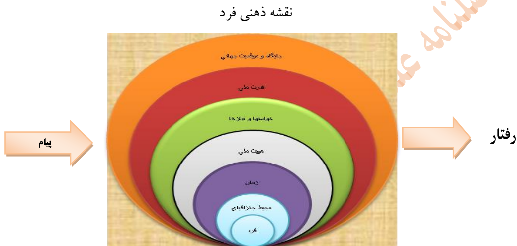
نمودار: اثر عوامل مختلف جنگ نرم

مادی و معنوی جامعه خود ناگزیر از بهره‌برداری از وسایل ارتباط جمعی شده است، وسایلی که با ارائه پیام‌های مختلف فرهنگی، اجتماعی، سیاسی و اقتصادی خود نقش مهمی در تحولات جوامع و دستاوردهای مادی و معنوی آنها دارد.